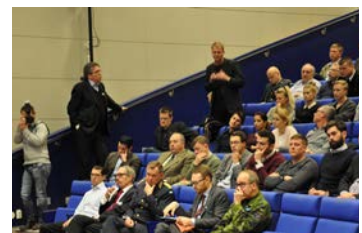
Seminarium om Försvarsmaktens insats i Mali i samarbete med Försvarshögskolan den 26 november.