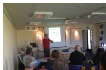
Grundkurs om krisberedskapssystemet i Karlstad. Kursen riktar sig till nyckelpersoner i frivilliga förstärkningsorganisationer för kommuner, länsstyrelser och myndigheter. Kursen arrangerades gemensamt mellan Försvarsutbildarna och Civilförsvarsförbundet på uppdrag av MSB.