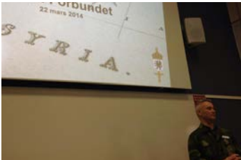
Överste Jan Demarkesse talade om kemiska vapen under Syrien-krisen under den inledande delen av årsstämman.