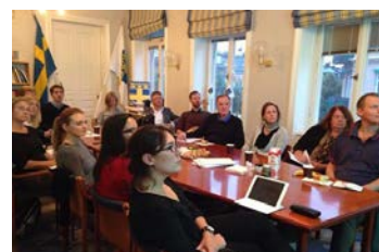
Medlemsmöte på Försvarsutbildarnas kansli i Stockholm. Två av kommunikatörerna som arbetade i insatsen vid branden i Sala berättade om sina erfarenheter.