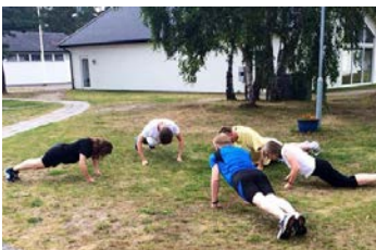
Fys under kursen Media gaming i Höllviken.