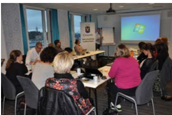
Helgkurs om kommunikation i offentlig förvaltning med inriktning mot civila uppdrag.