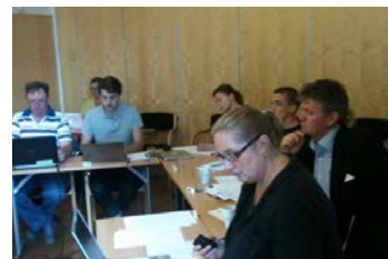
Befattningsutbildning i Tylebäck för de nio frivilliga omvärldsbevakarna som ingår avtal med Länsstyrelsen i Halland.