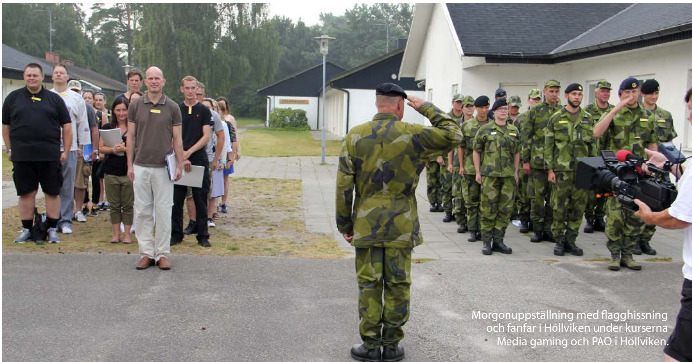
Morgonuppställning med flagghissning och fanfar i Höllviken under kurserna Media gaming och PAO i Höllviken.