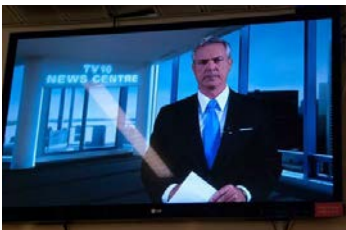
TV16 is on "The Air" på Viking14.