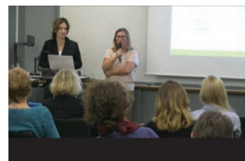
Rekryterings- och informationsmöte om Jordbruksverkets uppdrag för frivilligkommunikatörer. Se informationsmötet på http://vimeo.com/112328563 .