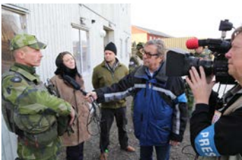
Under den nordiska stridsgruppens slutövning Joint Action 14 svarade medlemmar ur Criscom för medieträningen. Det är en mycket viktig pusselbit för stridsgruppen eftersom media alltid förekommer vid den typen av insatser.