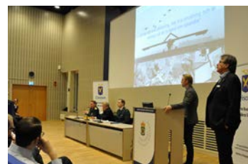
Seminarium om Försvarsmaktens insats i Mali i samarbete med Försvarshögskolan. Se seminariet på Youtube "Den svenska FN-insatsen i Mali".