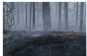
Branden i Sala.