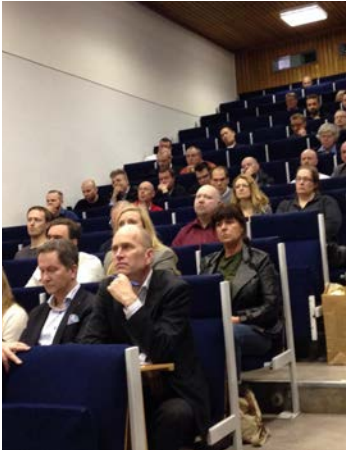
Medlemmar från hela landet deltog i årsstämman 2014.